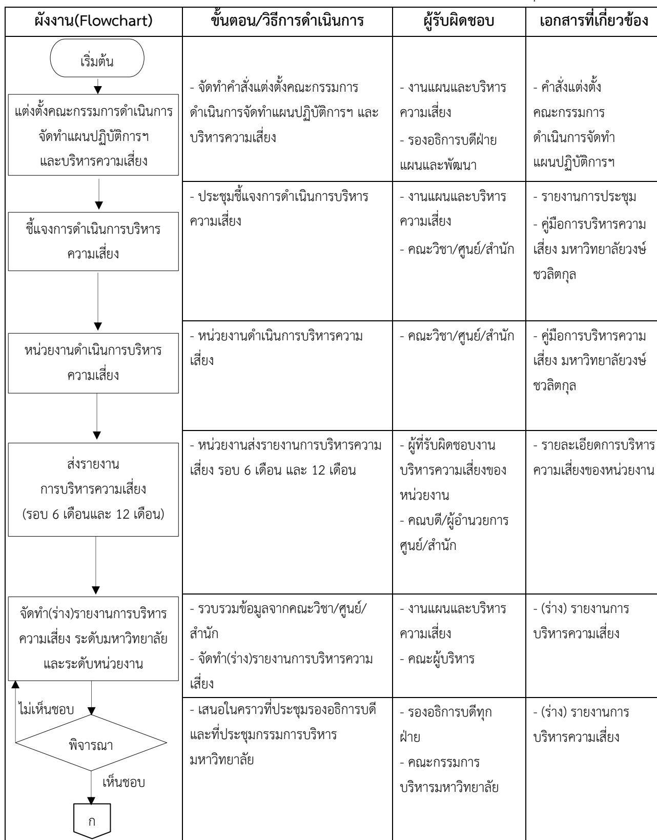
ตารางที่ 1.9 ขั้นตอนการดำเนินงานการบริหารความเสี่ยง มหาวิทยาลัยวงษ์ชวลิตกุล